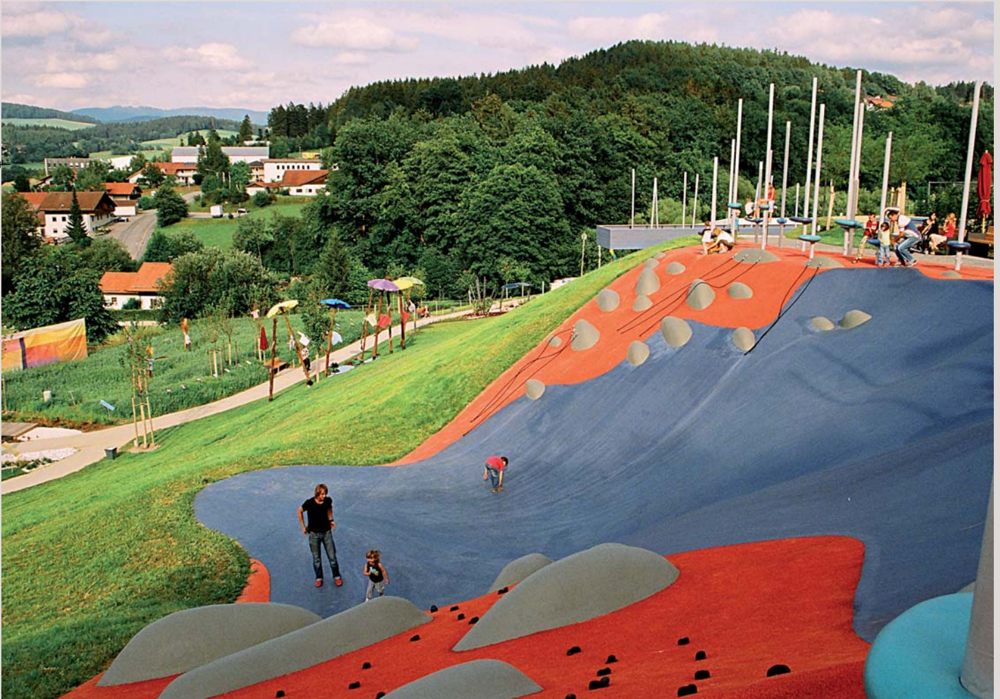
The Big hill slide. Waldkirchen, Baviera. El equipo de arquitectos paisajistas de Rehwaldt Landschaftsarchitekten estilizó una parte del paisaje de este parque, un plano inclinado con cimas, surcos y cantos rodados. El espíritu del proyecto era experimentar con la conexión entre topografía, juego y equipamiento. La cresta y la pendiente son de hormigón proyectado y la mayor parte del recubrimiento es de material sintético. Es un ejemplo de aprovechamiento del terreno como elemento lúdico.

Por su parte, los toboganes, columpios y equipos móviles satisfacen las necesidades de sociabilidad del niño. En estos espacios el juego se desarrolla en grupos, que se establecen de modo espontáneo, y los fabricantes de equipos de juego recogen esta circunstancia para dise-