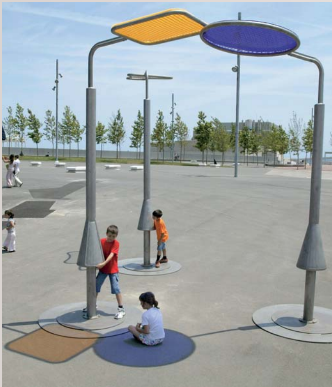
Juego de sombras. Diseño de Emiliana Design Studio y fabricado por Richter Spielgeräte. Es una pieza artística al tiempo que una herramienta creativa para el niño.

poblacional, los llamados seniors, reclama productos y servicios que cubran sus necesidades. Los ayuntamientos, sensibilizados con esta realidad están equipando espacios públicos con estos aparatos para realizar ejercicio físico moderado y adecuado a las características físicas de esta franja poblacional. Se trata de equipos cuya fabricación han asumido, desde el primer momento, los fabricantes de mobiliario urbano y juegos infantiles. Los ejercicios que estos aparatos proponen ayudan a prevenir y aliviar enfermedades cardiovasculares o artritis y, en general, su objetivo es lograr mejorar la calidad de vida de los mayores al tiempo que fomentar lugares de encuentro y diversión para todos. Además, los nuevos hábitos sociales colocan al abuelo y al nieto en disposición de compartir horarios y, por qué no, parque. ■