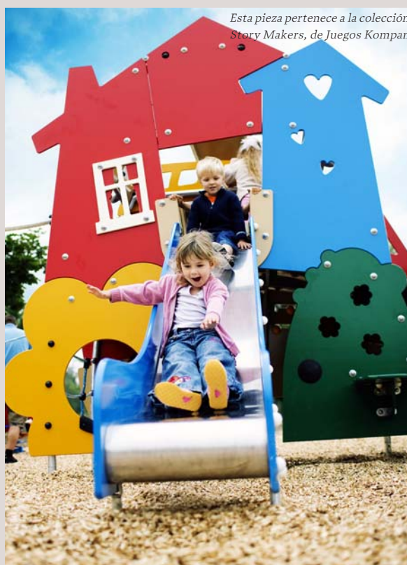
Esta pieza pertenece a la colección Story Makers, de Juegos Kompan