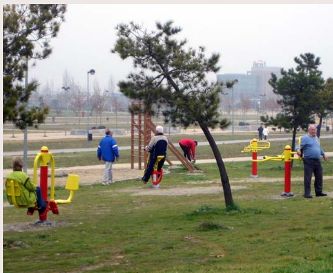
Parque en el recinto ferial de Coslada, en Madrid, con instalaciones para mayores. Los equipos son de Parques Geriátricos Drei.