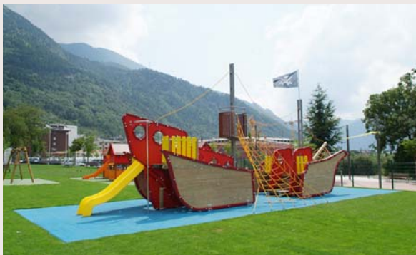
Barco Pirata, de Colomer. Fue fabricado con motivo de la remodelación del Parque de Turons d'Art en Escaldes-Engordany, Andorra. El barco tiene una longitud de 14 m con un sistema de cuerdas, redes de trepa, tobogán, paneles de escalada, torre vigía y hasta bandera pirata...