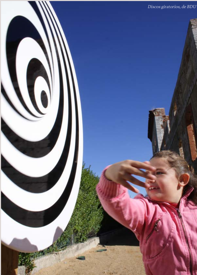
Discos giratorios, de BDU